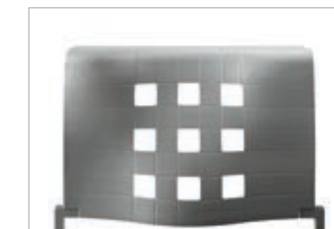
Antracita / Anthracite