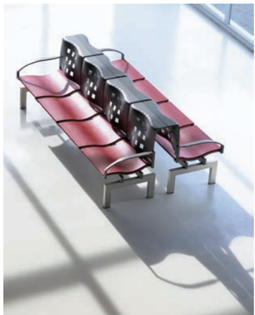
Posibilidad colocación espalda-espalda con posición fija de separación / Back to back installation with fixed distance position.