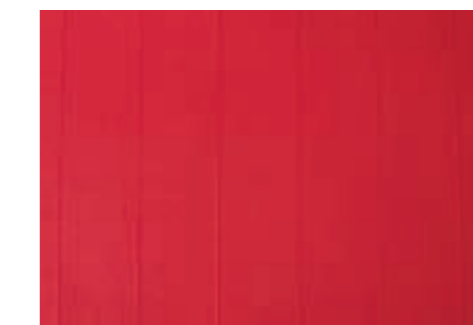
Rojo / Red NCS S2070-R