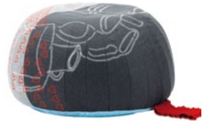
Bovist, Motif "Pottery"

partir de tissus multicolores, une beauté de graphisme exceptionnelle. Une poignée tricotée permet par ailleurs de déplacer Bovist dans l'appartement.