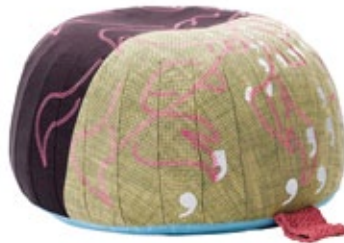
Bovist, Motif "Dove"

Bovist est à la fois un coussin de sol décoratif, un tabouret et un ottoman. Bovist doit sa forme sympathique et son agréable confort d'assise à des revêtements à couture latérale renforcée et à un rembourrage fait de petites billes en matière synthétique. De grandes broderies confèrent au revêtement réalisé, à