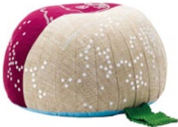
Bovist, Motif "Lacemaker"

Bovist est à la fois un coussin de sol décoratif, un tabouret et un ottoman. Bovist doit sa forme sympathique et son agréable confort d'assise à des revêtements à couture latérale renforcée et à un rembourrage fait de petites billes en matière synthétique. De grandes broderies confèrent au revêtement réalisé, à