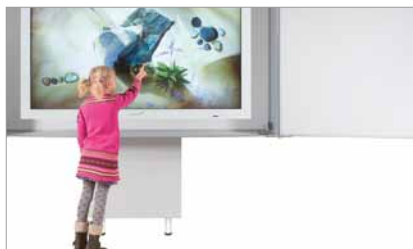
Télécommande de réglage de la hauteur

Un système PROFESSIONAL e-Screen FLEX peut comprendre un PROFESSIONAL e-Screen, une armoire et un élément mural réglable en hauteur