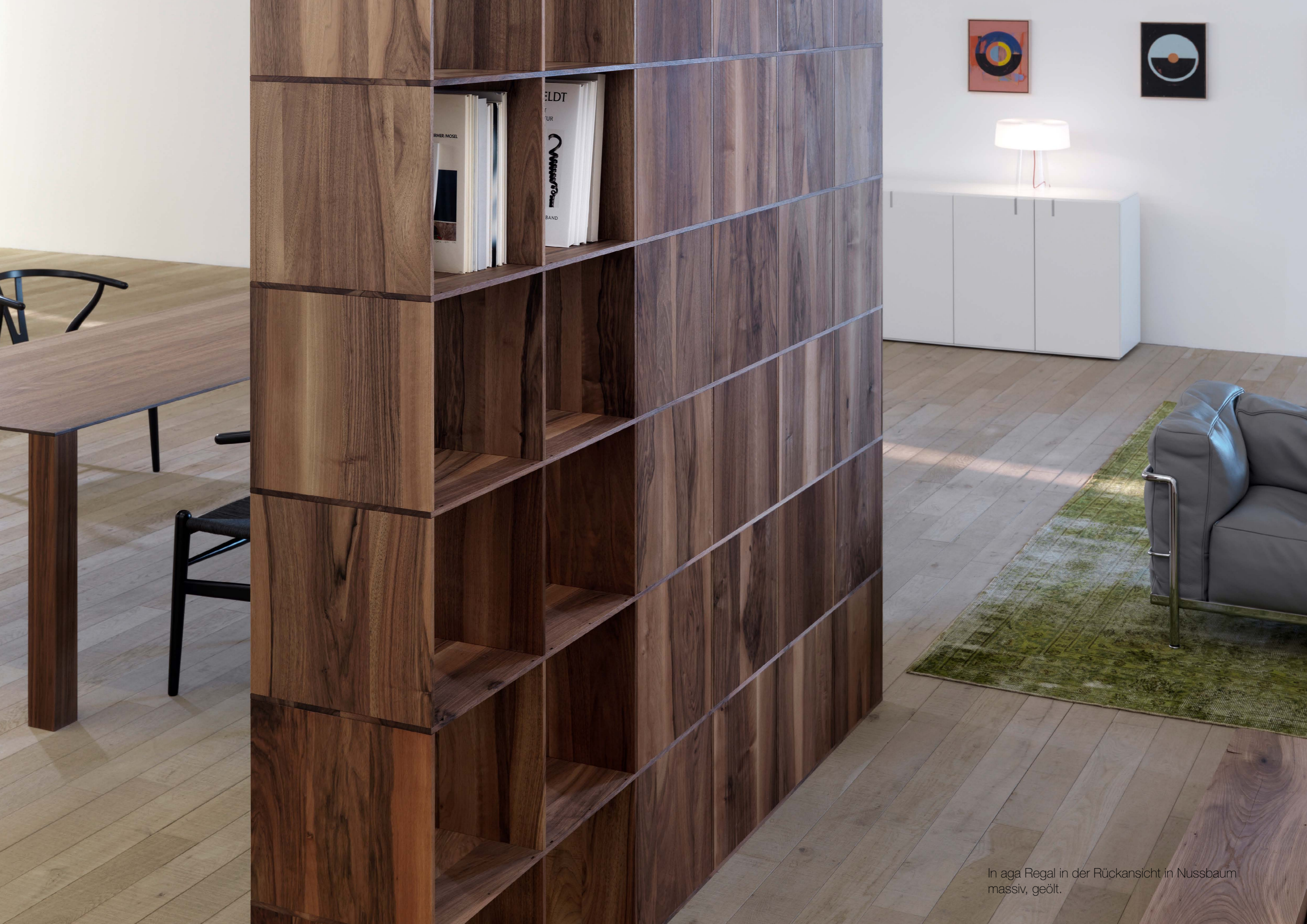
In aga Regal in der Rückansicht in Nussbaum massiv, geölt.